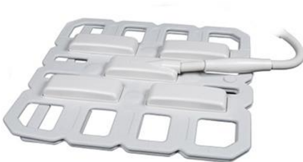
1. Bobina Atlas de corpo