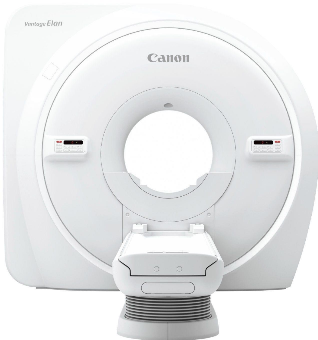
3. Vantage Elan 1.5T